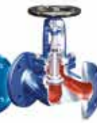
FABA® Válvulas de Fuelle