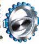
ZETRIX® Válvulas Triple Excéntricas