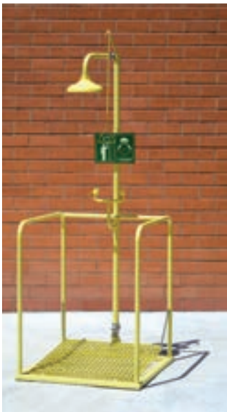
Ducha y lavajos en funcionamiento simultáneo (mod 4730).

La protección de las personas expuestas a ácidos, fuego y otros contaminantes es determinante para evitar daños graves o irreparables en el cuerpo y en los ojos. La accesibilidad y facilidad de accionamiento del equipo de emergencia es muy importante.